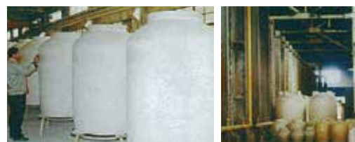
▲外観検査(白地検査)

外観検査（ひび、割れ、欠け）、安定性検査（すわりの悪さ）、水はり検査（水漏れ）、実際の貯蔵（液漏れ）を経て不良品が発生した場合は速やかに弊社にご一報願います。代金返却や次回納入での相殺などお打合せの上対応させていただきます。